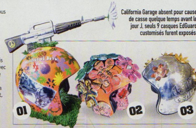
California Garage absent pour cause de casse quelque temps avant le jour J, seuls 9 casques EdGuard customisés furent exposés.

totalemt dérivées auxquelles ils nous avaient habitués lors des dernières éditions. La nostalgie d'une époque révolue a sans doute modéré leur extravagance coutumière pour leur faire préférer des allusions plus poétiques, à grand renfort de fleurs peintes ou en relief. Sortaient toutefois du lot le casque surmonté d'un M16 avec fleur au fusil de Duff Aero ou la visière peace and love de Skin ASS, la palme revenant sans conteste, même s'il n'y a aucune espèce de forme de classement, à la "sculpture" du Coq Trainard. Une histoire à vous enfoncer le signe de la paix dans le crâne, une fois pour toutes!