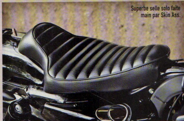
Superbe selle solo faite main par Skin Ass.