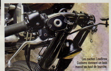
Les caches LowBrow Customs donnent un look massif au haut de fourche.