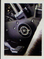
Le seul détail qui trahit l'appartenance de cette moto à Eddy The Vintage est ce point cover discret, gravé au laser.