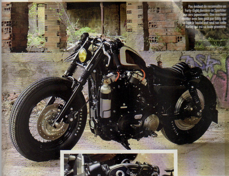
Pas évident de reconnaître un Forty-Eight derrière ce Sportster aux airs japonais. Une machine blanche avec bien goût et un côté qui sape le budget tout seul sur cette Harley qui est sa toute première.