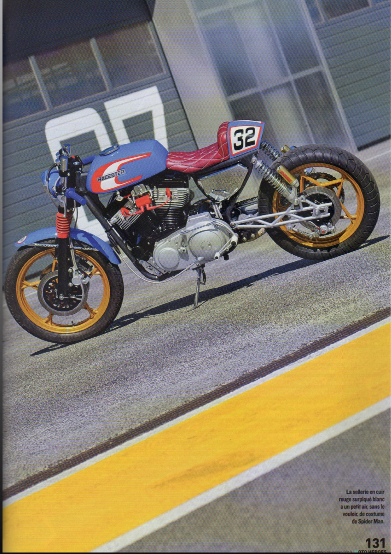
La sellerie en cuir rouge surpiqué blanc a un petit air, sans le vouloir, de costume de Spider Man.