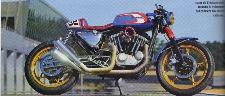
Chaque pièce de moteur est passée sous les mains de Stéphane pour recevoir le traitement qui convient aux racers radicaux.