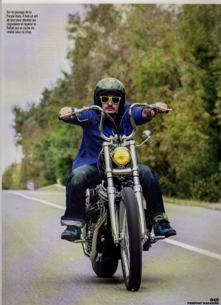
Sur le passage de la Purple Haze, il faut un œil de lynx pour déceler les clipsants et respirer la Softail qui se cache en réalité sous ce chop.