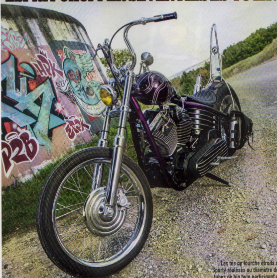
Les tés de fourche étroits de Sporty réalisés au diamètre des tubes de big twin participent au charme lou du train avant.